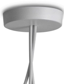
F0093009 Multiple rosace - Blanc