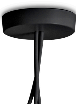
F0093030 Multiple rosace - Noir