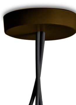
F0093026 Multiple rosace - Anodisé brun